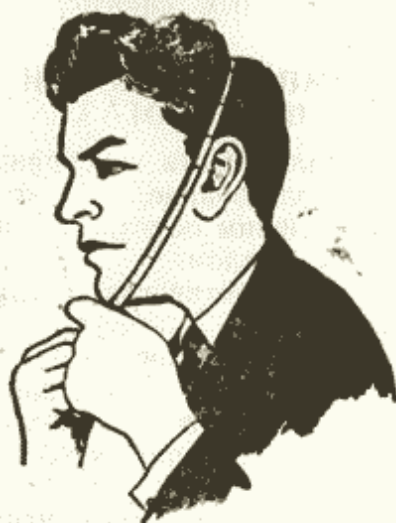
Рис. 2. Измерение головы

5.1. Подготовка противогаса к эксплуатации начинается с определения требуемого размера лицевой части.