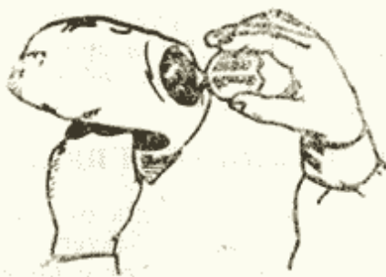
Рис. 3. Вставка незапотевающей пленки

В случае затруднения при извлечении прижимного кольца от руки примените твердый подручный предмет (пряжку, ключ и т. п.), используя для этого принцип рычага. При этом один конец рычага (подручного предмета) подведите под выступающий сегмент на прижимном кольце и, упираясь пальцем руки в стекло, поднимите кольцо вверх (к себе).