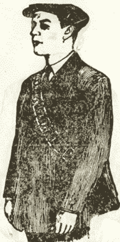
Рис. 4. Противогаз в «походном» положении К—3311

—сложите шлем-маску, уложите противогаз в сумку и застегните ее;