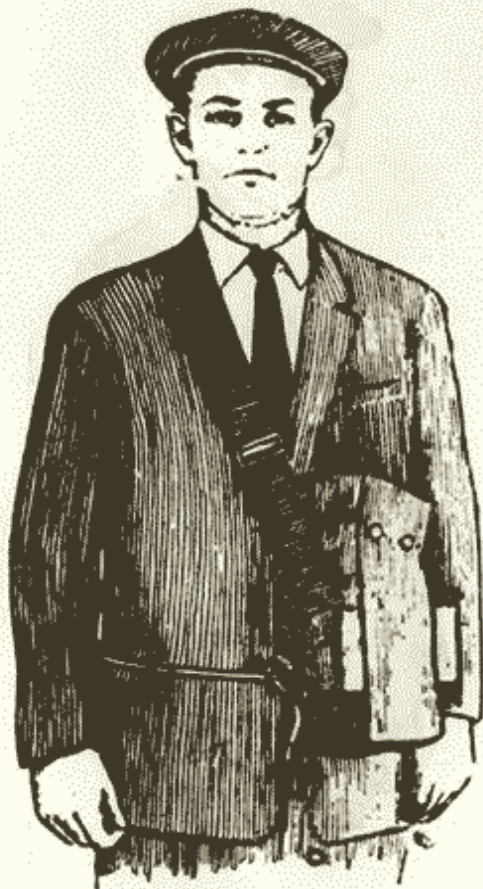
Рис. 5. Противогаз в положении «наготове»

9.4. Перевод противогаза в положение «наготове» производится из «походного» положения при непосредственной угрозе ядерного, химического или бактериологического (биологического) нападения, для этого передвиньте сумку с противогазом вперед настолько, чтобы можно было вынуть противогаз из нее, расстегните сумку; подготовьте головной убор для быстрого снятия при надевании шлем-маски на голову (рис. 5).