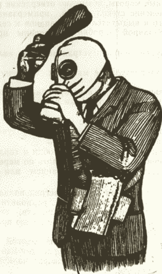
Рис. 7. Снятие противогаза

—выверните шлем-маску и тщательно протрите ее внутреннюю поверхность чистой тряпочкой, платком или просушите;